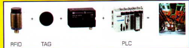
RFID TAG PLC

* การประยุกต์ : ติดโน้ผลิตภัณฑ์เพื่อทำ STOCK / INVENTORY / e-KANBAN สายผลิตรถยนต์ สามารถต่อรับข้อมูลจาก PLC ได้โดยตรง