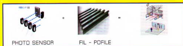
PHOTO SENSOR FIL - POFILE

* การประยุกต์ : ใช้ทำอุปกรณ์ SAFETY เครื่องจักร / เครื่องปั๊ม / แชนล หรือ ป้องกันบริเวณพื้นที่ หวงห้าม อันตรา