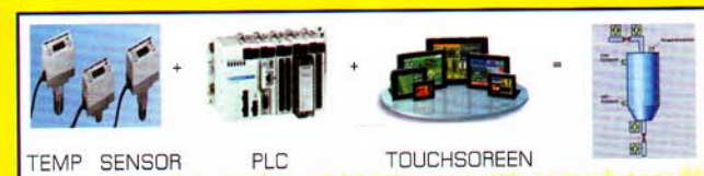
TEMP SENSOR PLC TOUCHSCREEN

* การประยุกต์ : ใช้ควบคุมอุณหภูมิ เต้าหลอม เครื่อง Preheat Mold เครื่องจักร อุปกรณ์ควบคุมอุณหภูมิทุกแบบ