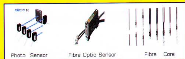
Photo Sensor Fibre Optic Sensor Fibre Core