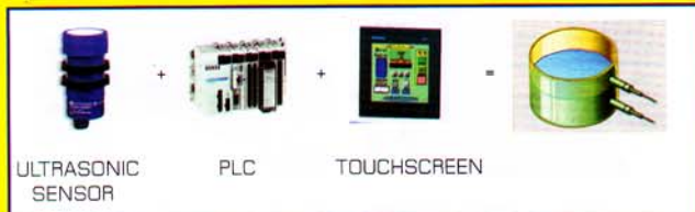
ULTRASONIC SENSOR PLC TOUCHSCREEN

* การประยุกต์ : ใช้วัดระดับของเหลว วัตถุดิบในกระบวนการสามารถควบคุม การปิดเปิดวาล์ว