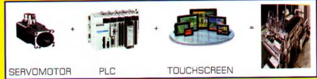
SERVMOTOR PLC TOUCHSCREEN

* การประยุกต์ : ทำเครื่องตัดป้อนระยะ เครื่องตัดฉากระบบสายพานลำเลียง เครื่องจักรอัตโนมัติ