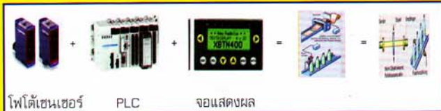
โฟโตเซ็นเซอร์ PLC จอแสดงผล

* การประยุกต์ : ใช้ร่วมกับสายพานการผลิตเพื่อนับจำนวนผลิตภัณฑ์และแสดงผล รายงาน จำนวนยอดการผลิต